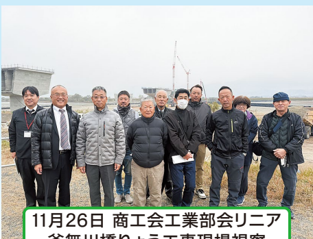
11月26日 商工会工業部会リニア釜無川橋りょう工事現場視察