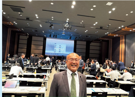
11月12日 都道府県議会議員研究交流大会