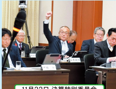
11月22日 決算特別委員会