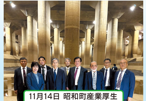
11月14日 昭和町産業厚生常任委員会県外視察同行