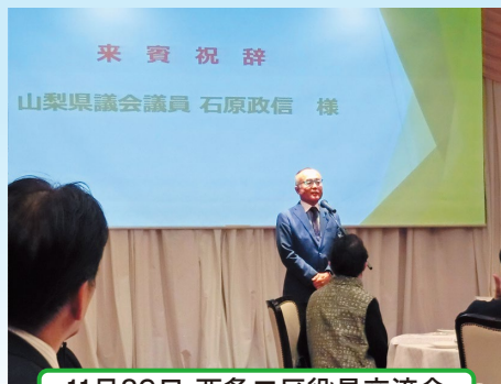
11月29日 西条二区役員交流会