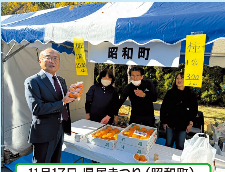
11月17日 県民まつり(昭和町)