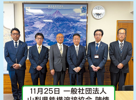
11月25日 一般社団法人山梨県鉄構溶接協会 陳情