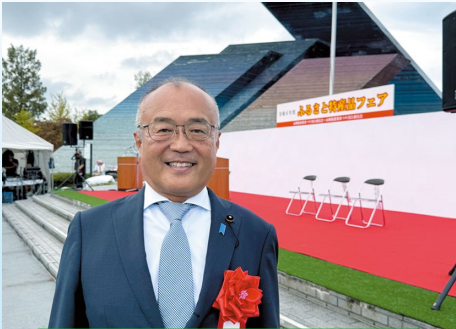
10月19日 ふるさと特産品フェア