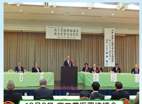
12月2日 商工業振興協議会