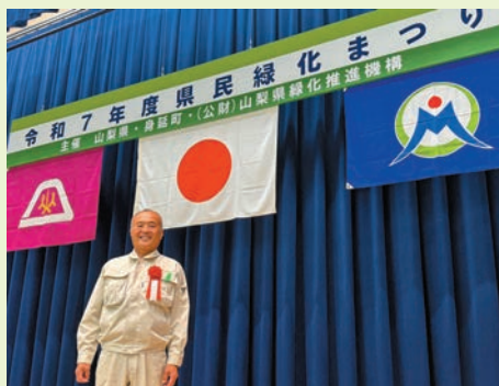
5月17日・山梨県民緑化まつり