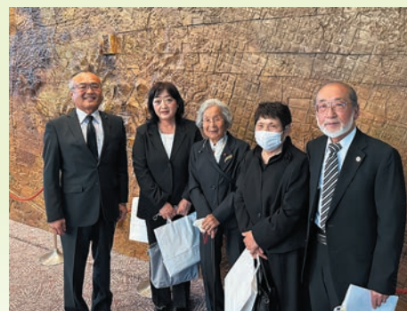
5月30日・県下戦没者慰霊祭