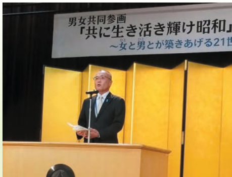
3月8日・男女共同参画 共に生き活き輝け昭和フォーラム