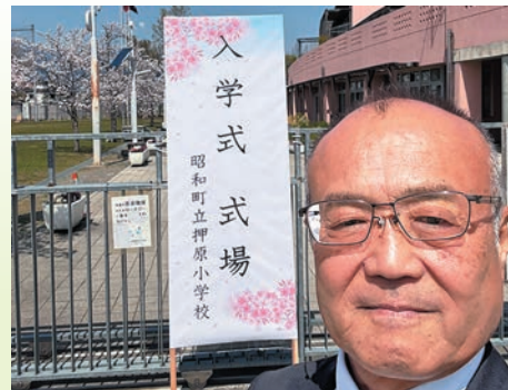
4月8日・押原小学校入学式