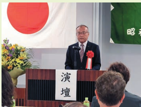
5月26日・昭和町商工会通常総会