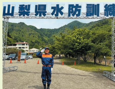
5月18日・山梨県水防訓練