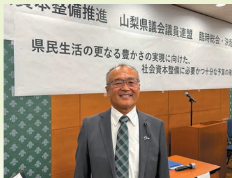
5月28日・社会資本整備推進 山梨県議会議員連盟 臨時総会(東京)