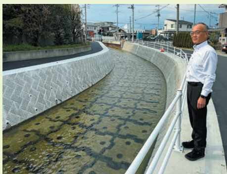
4月10日・鎌田川護岸工事完成