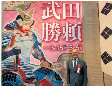
3月14日・県立博物館 開館20周年 記念特別展 武田勝頼展オープニング