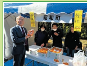
R6.11 県民まつり(昭和町)