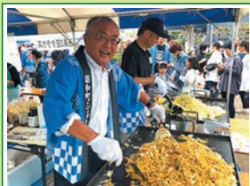
R5.10 昭和町ふるさと ふれあい祭りに参加