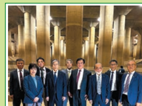
R6.11 昭和町産業厚生常任 委員会 県外視察同行