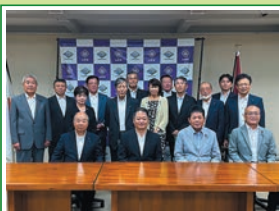
R5.9 知事と昭和町議・職 員との意見交換会を開催