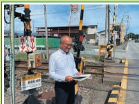
R6.7 昭和町の危険踏切を 視察 担当各所と情報共有