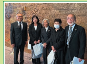
R7.5 県下戦没者慰霊祭 終戦から80年の節目