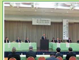
R6.12 商工業振興協議会