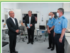
R5.8 総務委員会県外調査 青森県警 新通信指令システム