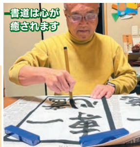
書道は心が癒されます