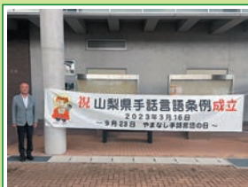
R5.9.23 山梨県 手話言語条例成立