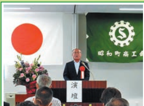
R6.5 昭和町商工会通常総代会 地域経済の基盤強化に尽力