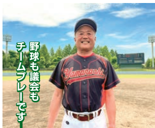
野球も議会もチームプレーです