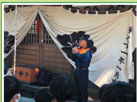
R5.8 西条二区自主防災訓練 消火・炊き出し訓練等実施