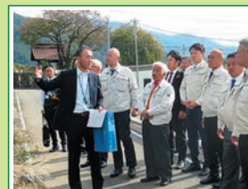
R6.11 土木森林環境委員会 北杜市役所・市内現地調査