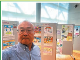
R6.6 男女共同参画推進 月間 図画コンクール