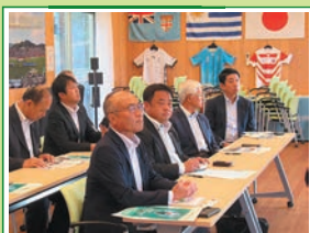
R5.8 総務委員会県外調査 釜石鶴住居復興スタジアム