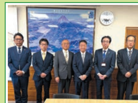
R6.11 一般社団法人 山梨県鉄構溶接協会 陳情