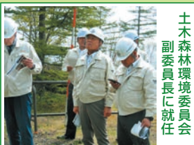
R6.5 土木森林環境委員会 富士スバルライン災害現場視察