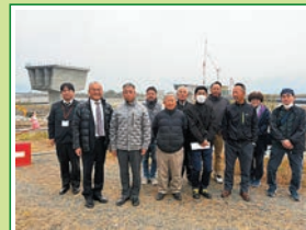
R6.11 商工会工業部会 リニア釜無川橋梁工事現場視察