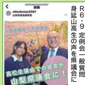
R6.9 定例会一般質問 身延山高生の声を県議会に