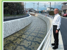
R7.4 鎌田川護岸工事完成