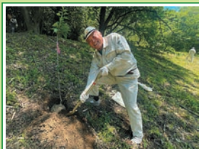
R6.5 県民緑化まつりに 参加(御坂路さくら公園)