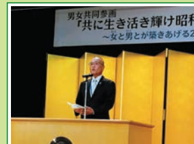
R7.3 男女共同参画 共に 生き生き輝け昭和フォーラム