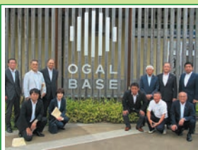
R5.8 総務委員会県外調査 公共用地の高度活用について