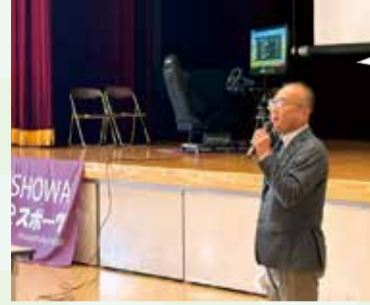
昭和町社協eスポーツ大会 (1月27日)