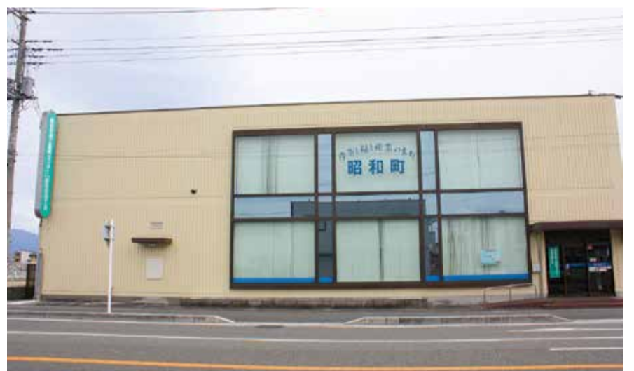
「昭和町商工会」(3月19日、昭和町西条)

加えて、商工会が自ら生み出している優良事例の活用も重要。企業のDX推進については、既に多くの成功事例が創出されていて、県の支援策と組み合わせ、DX導入の拡大を図る。