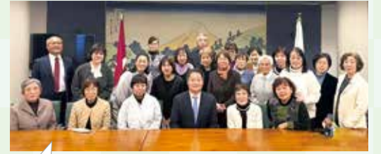
知事と昭和町女性団体との意見交換会(1月28日)