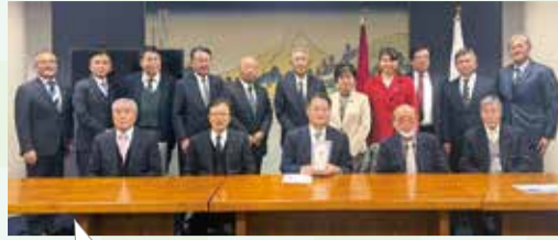
知事と昭和町議の意見交換会(1月21日)