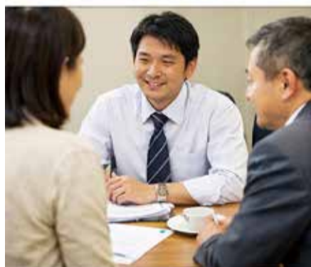
授業④、職員室で事務④、父母対応④と多忙な教員の1日(生成AIで作成)