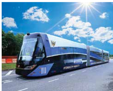
富士トラムの走行イメージ

構想で、富士山の麓から五合目までの電気・通信設備の基本設計を実施する。車両は「欧州製車両導入検討費」を計上。また、再生可能エネルギーで水を電気分解してつくるグリーン水素の実用化へ、産学官連携の協同組織設立や情報発信拠点整備の調査を行う。タクシー会社十数社の市街地での配車アプリを活用した共同配車システ