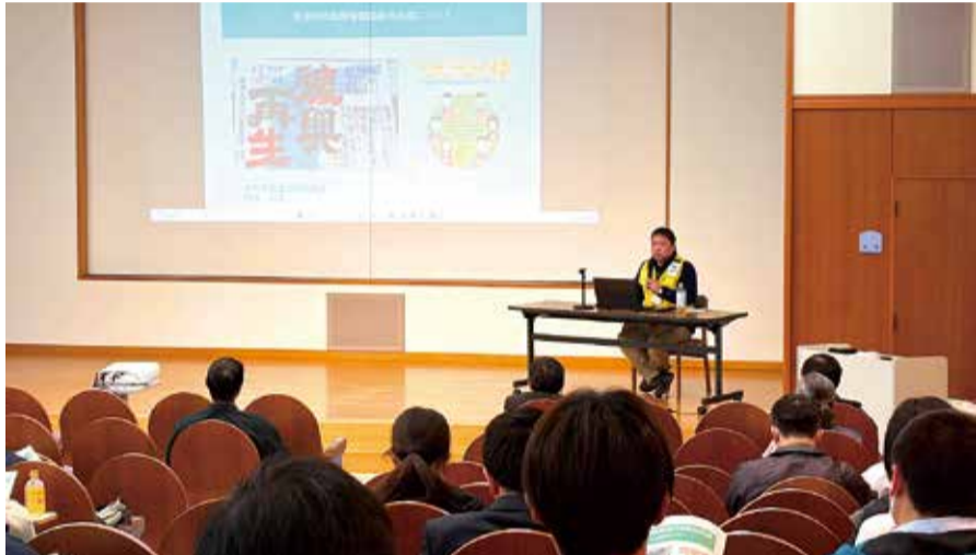
DMAT、DWATなどの連携検討会議(2025年12月9日、中央市玉穂)

災害発生時は、県は被災者の生命と健康分野の支援を総合調整する「保健医療救護対策本部」を設置することになっている。発災当初は、救命・救急の医療活動が中心となるが、避難所生活が始まるため、保健・福祉支援ニーズも急速に高まる。被災現場で医療活動を行うDMAT(ディーマツト)や、避難所で高齢者などの要配慮者を支援するDWAT(ディーワット)をはじめ、保健・医療・福祉の各分野の支援チームが連携する体制が不可欠だ。