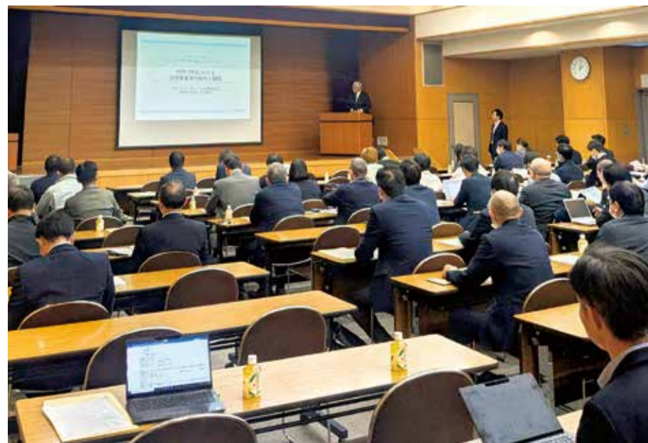
PPP・PFI導入促進へ「スタートコーポレーション」が甲府市内でセミナー(2025年12月8日)

代表的な手法が、公共施設の建設、維持、運営を民間の資金、経営、技術を活用して行うPFIで、効率的に公共サービスが提供できる。スモールコンセッションは、小規模な官民連携事業により、エリア価値の向上につなげる取り組み。