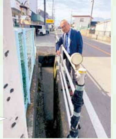
河東中島地区県道改良要望場所の現地調査(2月14日)