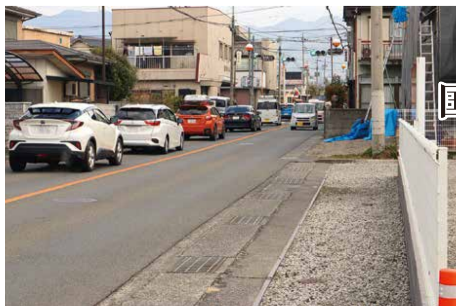
前方が国母駅入口の信号機。右側路肩が拡幅エリア(2026年3月9日)

保健は病気の予防と健康づくり。医療は診断と治療・リハビリ。福祉は生活・自立支援。