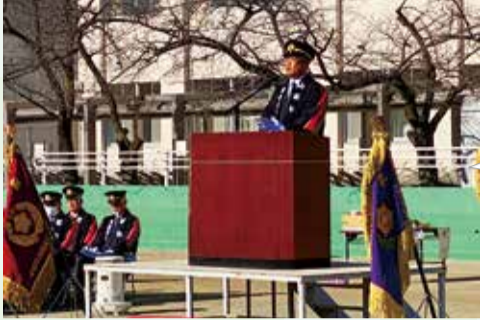
昭和町消防出初式 (1月12日)