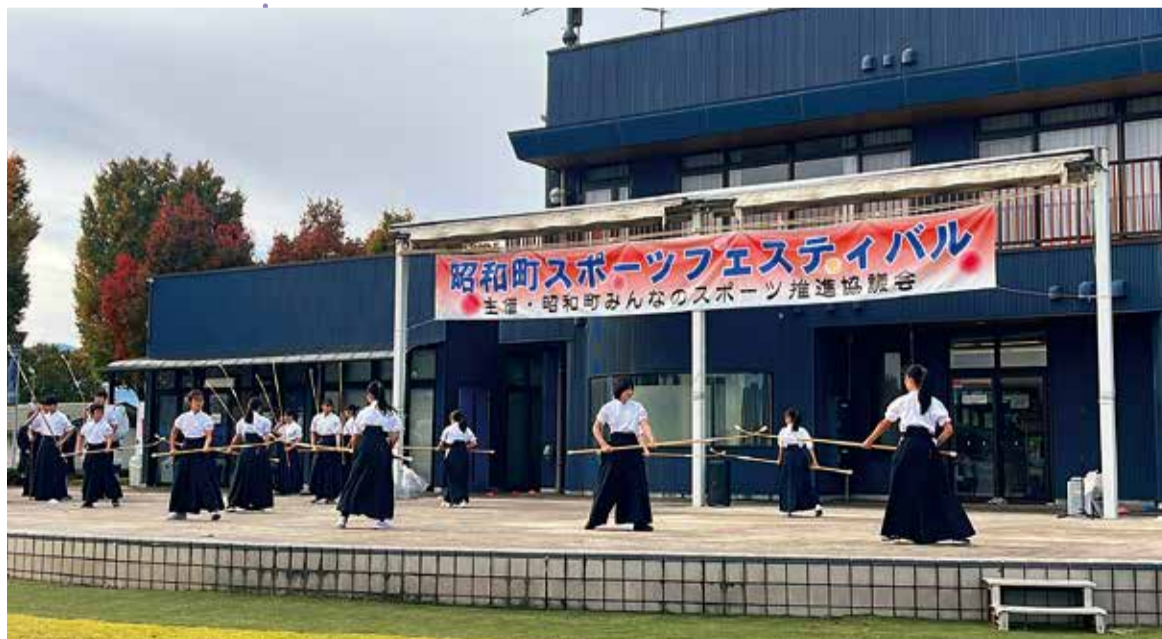
昭和町スポーツフェスティバルに出演した「昭和総合型地域スポーツクラブ・カメラリア」の「なぎなた部」(2025年11月2日、昭和町押越)

子どもたちの継続的なスポーツ・文化芸術活動確保のため、学校での部活動から、地域が主体の地域クラブ活動へ転換すること。