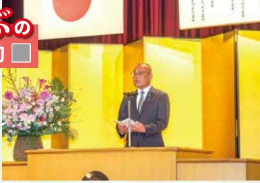
二十歳の集い (1月11日)